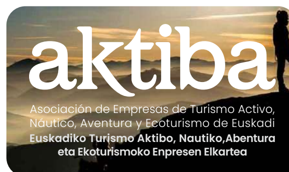
Versión con opacidad (65% mínimo)